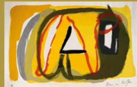
Gobelin: Bram Van Velde

Workshop: Lørdag den 17. og søndag den 18. august, samt lørdag den 24. og søndag den 25. august. Tider: kl. 11.00, kl. 13.00. kl. 15.00. Hver workshop har 1 times varighed.